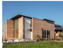
「SPウッド」を使用した住宅の構造材で情報が確認出来る外壁には羽柄材を使用