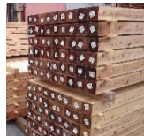
QRコードによって履歴・品質が管理された地域材「SPウッド」