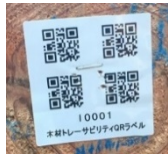
原木丸太伐採時から製品になる迄の木材履歴情報が入力されたQRコード