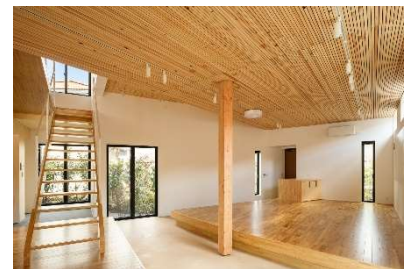
DLT 吸音タイプ活用事例(天井)