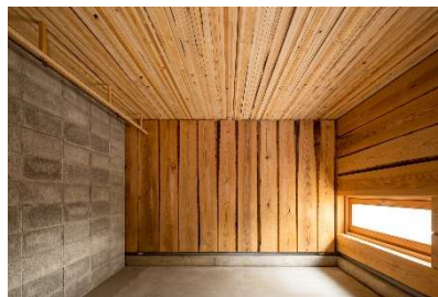
DLT 丸身タイプ活用事例(天井)